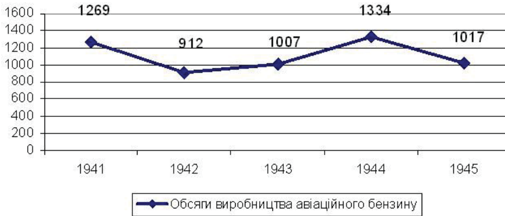
Рис. 1. Виробництво авіаційного бензину в СРСР протягом 1941–1945 рр., тис. тонн

– збільшення обсягів виробництва та підвищення якості радянського пального за рахунок його змішування з імпортними нафтопродуктами. Фактично, більшу частину імпортного авіабензину було включено в радянське виробництво (рис. 1). Із урахуванням цього факту, за розрахунками Б. Соколова, поставки пального за ленд-лізом для літаків у 1,4 раза перевищували радянське виробництво 19 .