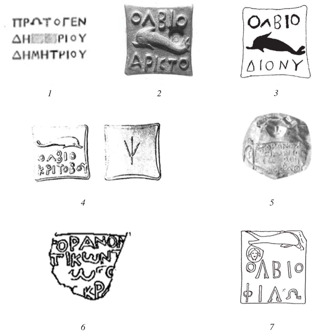
Рис. 2. Керамічні клейма та агораномні гирі Ольвії (ч. 2). Рисунки і світлини В. В. Крапівіної, В. В. Рубана